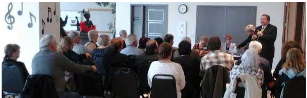
Photo de l'Assemblée générale annuelle du 21 septembre 2014