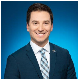
Simon Jolin-Barette Ministre de la Justice

Mais plus fondamentalement, 2020-2021 a été l'année de la préparation à deux importantes batailles de notre organisme et de nos alliés pour protéger les droits des grands-parents. En effet, le gouvernement fera en 2021-2022 deux importantes réformes qui affecteront les droits des grands-parents.